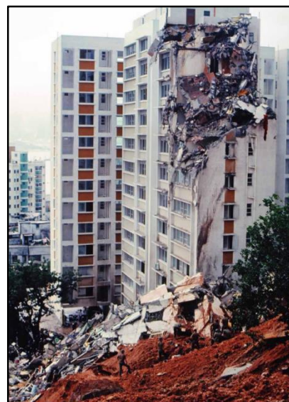
1972 年 6 月 16-18 日暴雨連場，導致嚴重山泥傾瀉，其中香港島半山區十二層高的旭龢大廈完全摧毀。

山泥傾瀉： 香港地勢多山且山勢陡峭，加上亞熱帶氣候以及深厚的風化土層，都是導致山泥傾瀉發生的主要因素。然而，沒有密集的民居，和歷史（特別是二次大戰後香港迅速發展期間）遺留下許多不合格的人造斜坡，山泥傾瀉的發生也不一定導致災難性的後果。1972 年 6 月的雨災喚醒了政府和市民對斜坡的關注，專責監管斜坡安全的土力工程處亦因此在 1977 年成立，致力減低山泥傾瀉風險。