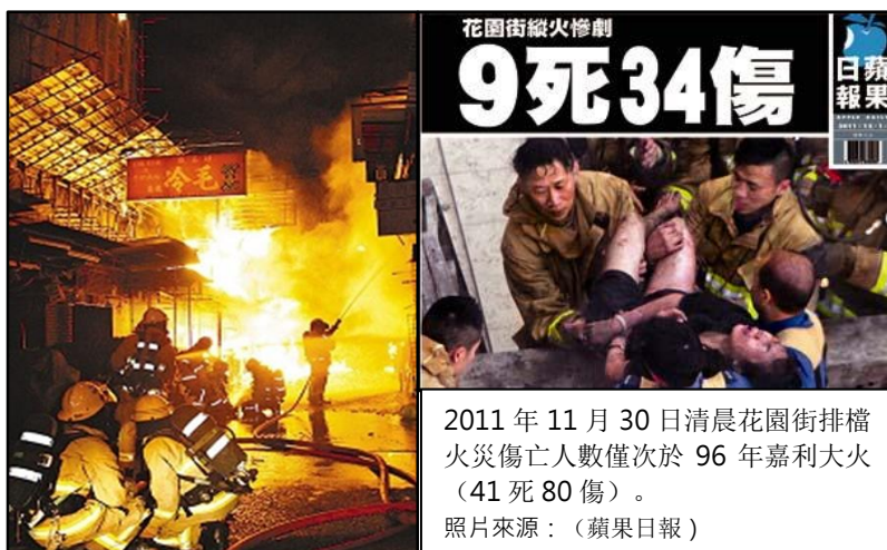
2011 年 11 月 30 日清晨花園街排檔火災傷亡人數僅次於 96 年嘉利大火（41 死 80 傷）。

除了天然災害，香港多年來當然亦不乏重大人為災害，近年就有 2011 年花園街大火、2012 年南丫島撞船事故、以至今慈雲山車房石油氣爆炸，都揭示人為疏忽及不當操作等行為可以導致災害性的人命財產損失。